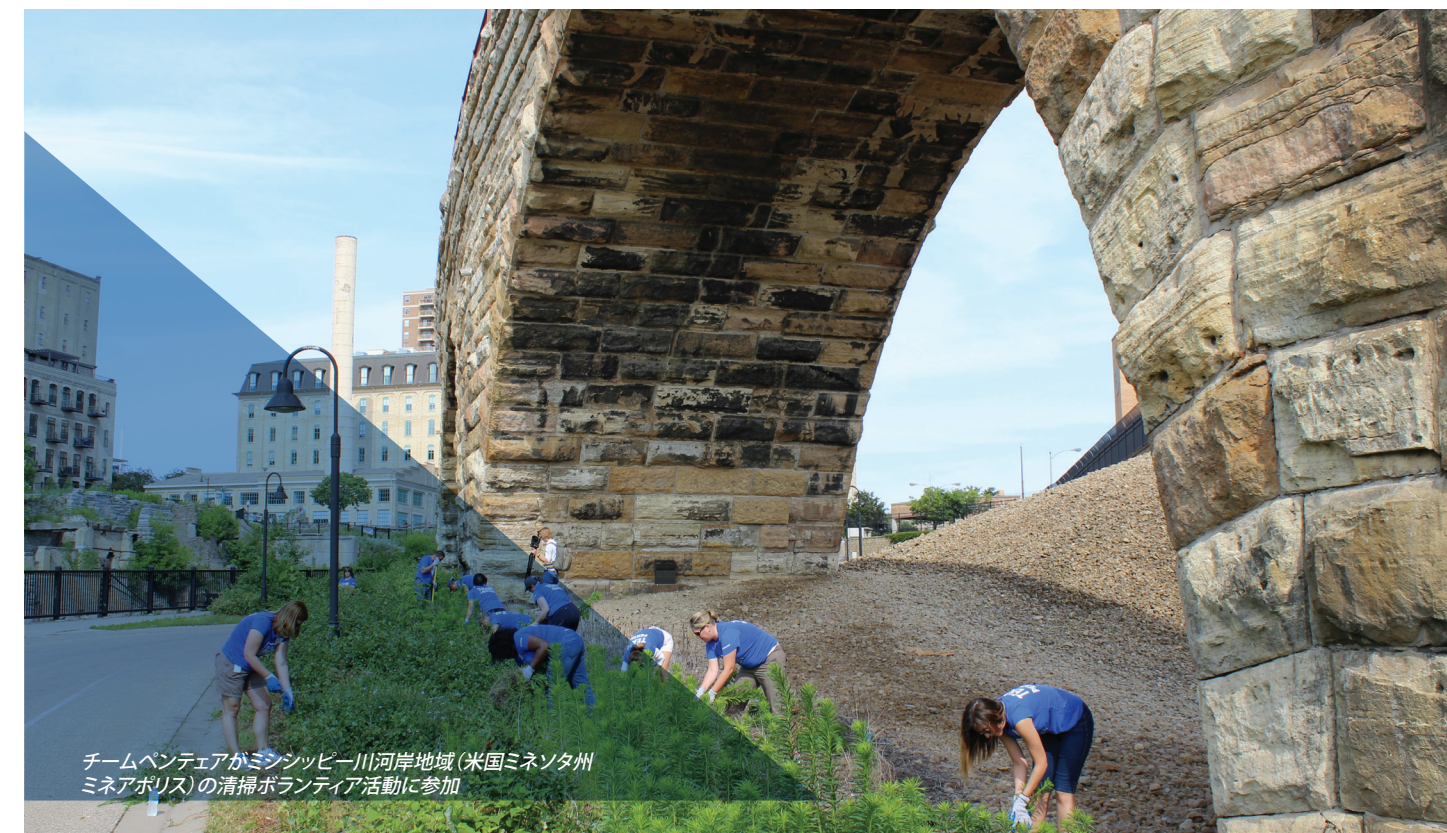
チームペンテアがミシシッピ川河岸地域(米国ミネソタ州ミネアポリス)の清掃ボランティア活動に参加

ペンテアの実業委員会または取締役会のガバナンス委員会のみが、執行役員または取締役に対する本規範の免除を行うことができます。