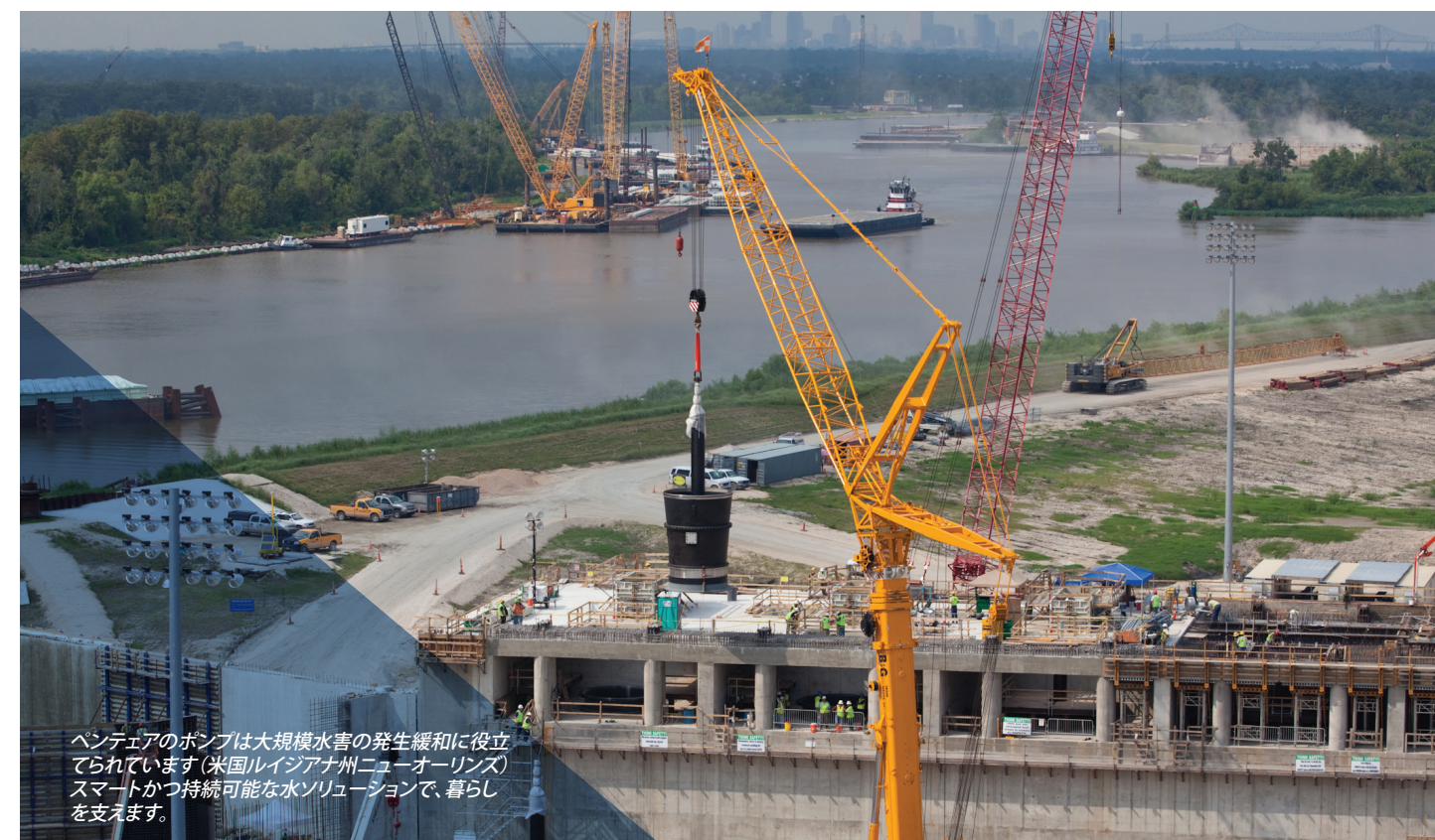
ペンテアのポンプは大規模水害の発生緩和に役立てられています (米国ルイジアナ州ニューオーリンズ) スマートかつ持続可能な水ソリューションで、暮らしを支えます。

A: 工場視察は認められますが、ディズニーワールドへの旅行は許されるものではなく、賄賂の一形態です。いかなる状況でも、当社は顧客に同行する家族の旅費や、ペンテアの事業とは関係のないディズニーワールドまたはその他の目的地までの旅費を支払うべきではありません。