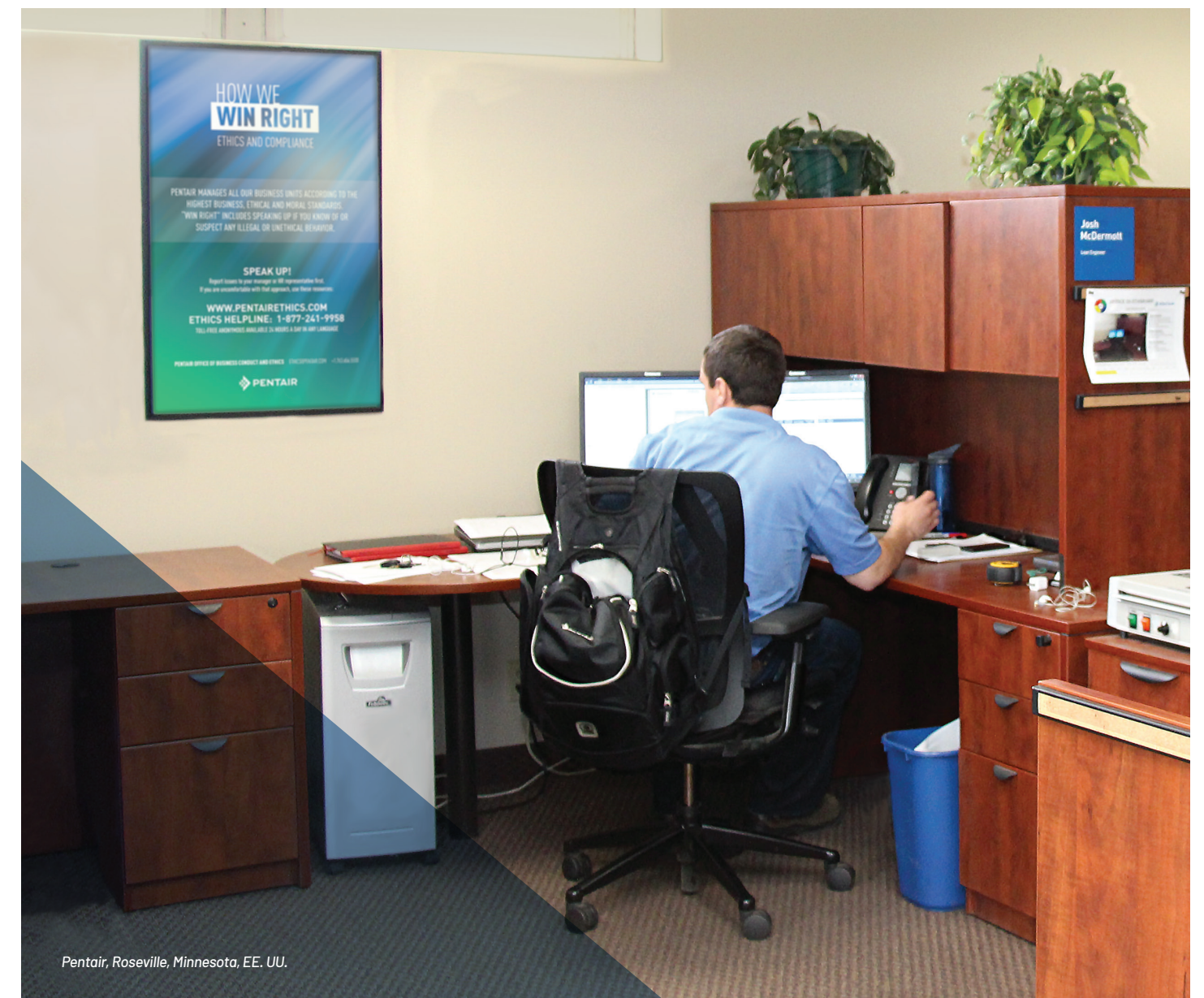
Pentair, Roseville, Minnesota, EE. UU.

R: Pentair toma las denuncias de represalia con mucha seriedad. Esto significa educar a los empleados y la administración sobre qué es la represalia y asegurarse de que comprendan las consecuencias. Si se comprueba una denuncia de represalia, la empresa sancionará a las personas involucradas, lo que puede incluir hasta el cese del empleo.