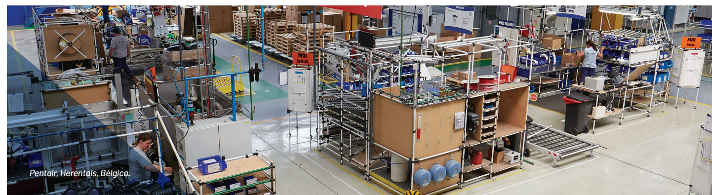
Pentair, Herentals, Bélgica.

Pentair investigará todos los incidentes, las lesiones y los percances para que se implementen medidas correctivas permanentes y no se repita la causa.