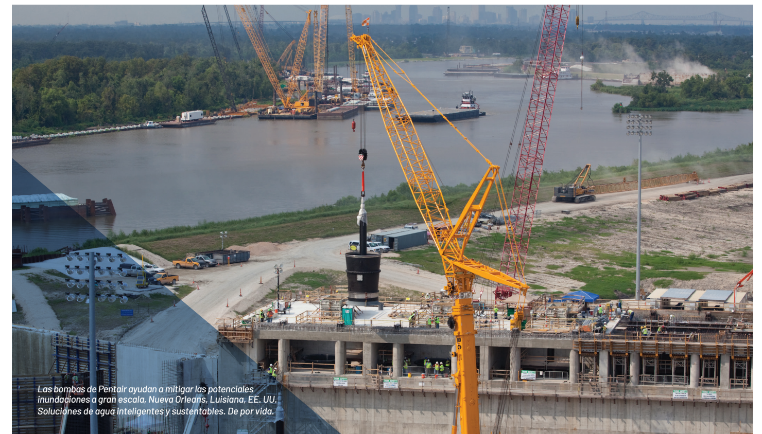
Las bombas de Pentair ayudan a mitigar las potenciales inundaciones a gran escala, Nueva Orleans, Luisiana, EE. UU. Soluciones de agua inteligentes y sustentables. De por vida.

R: Mientras que las visitas a la planta pueden ser aceptables, el viaje a Disney World no está permitido y es una forma de soborno. En ningún caso debemos pagar para que los familiares de un cliente viajen con él o ella, ni pagar por un viaje a Disney World ni ningún otro destino no relacionado con los negocios de Pentair.