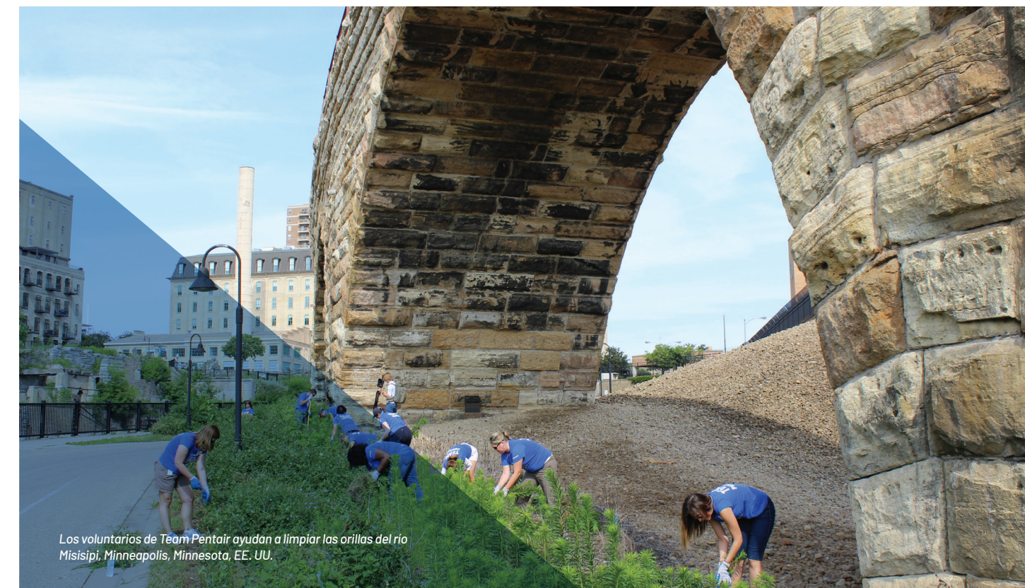
Los voluntarios de Team Pentair ayudan a limpiar las orillas del río Misisipi, Minneapolis, Minnesota, EE. UU.

Solo la Junta directiva o el Comité de gobierno de la junta de Pentair pueden llevar a cabo una renuncia del Código para los funcionarios ejecutivos o directores.