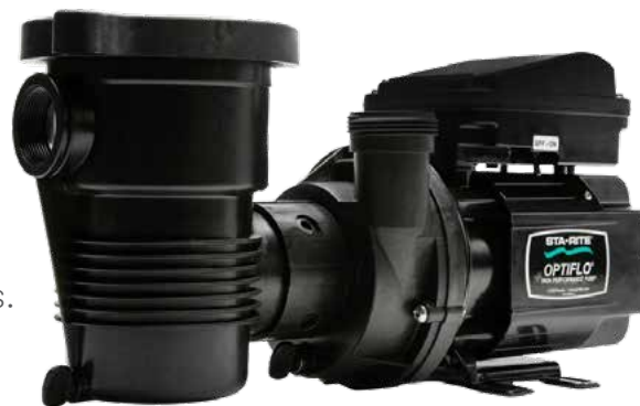
Pompe pour piscine hors terre OptiFlo

Elle est également extrêmement facile d'entretien. Dans l'ensemble, voici un moyen économe en eau offrant tranquillité d'esprit aux propriétaires de piscine hors terre bien après l'entrée en vigueur des règlements.