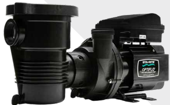
Pompe pour piscine hors terre OptiFlo

Remarque : Les pompes OptiFlo 3/4 HP, OptiFlo 1,5 HP et toutes les pompes Dynamo représentées ici sont des produits non conformes inclus strictement aux fins de comparaison. La nouvelle pompe OptiFlo 1,0 THP est la seule série de pompe pouvant être commandée.