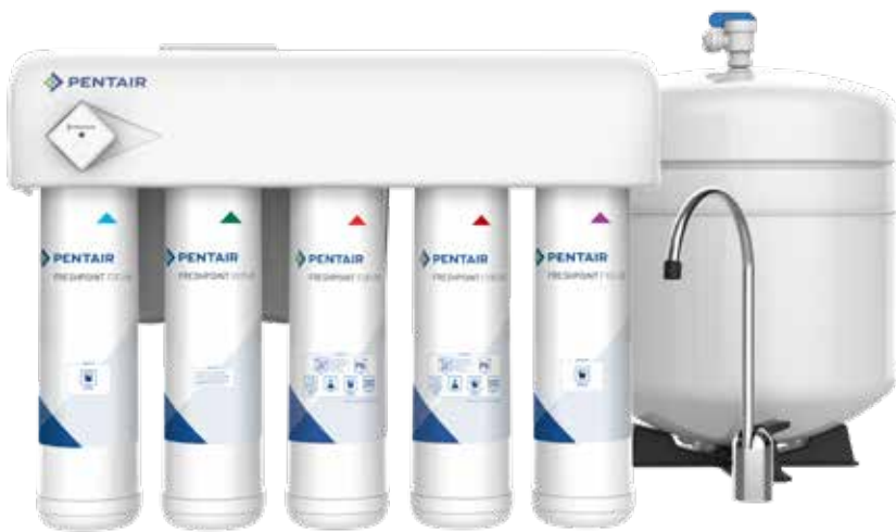
GRO-575M, (Incluye monitor de duración del filtro) mostrado