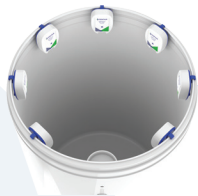
ROUND BRINE TANK TANQUE DE SALMUERA REDONDO