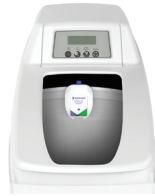
CABINET SOFTENER ABLANDADOR TIPO GABINETE