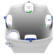
SQUARE BRINE TANK TANQUE DE SALMUERA CUADRADO

Avoid mounting the sensor within 2" of corners or brine well. Evite montar el sensor a menos de 2" de las esquinas o del pozo de salmuera.