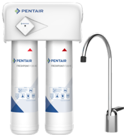
F2000-B2M, (with filter life monitor) shown