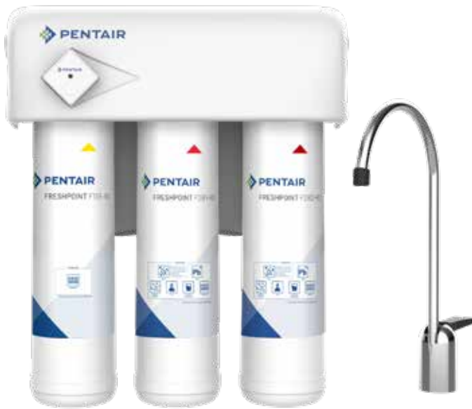
F3000-B2M, (monitor de duración del filtro) mostrado