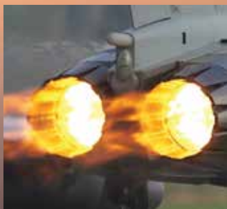
El titanio resiste las altas temperaturas en las turbinas de los jets militares. 1

El software con menú intuitivo permiten que la configuración y el funcionamiento sean muy sencillos.