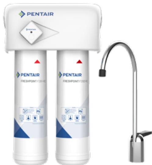
F2000-B2M, (Comprend le contrôleur de durée de vie du filtre illustré)