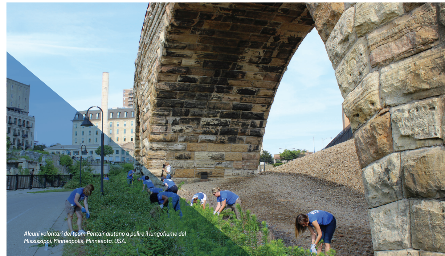
Alcuni volontari del team Pentair aiutano a pulire il lungofiume del Mississippi, Minneapolis, Minnesota, USA.

Qualunque rinuncia al Codice dei dirigenti o dei direttori può essere effettuata solo dal Consiglio di amministrazione di Pentair o dal Comitato per la Governance del Consiglio.