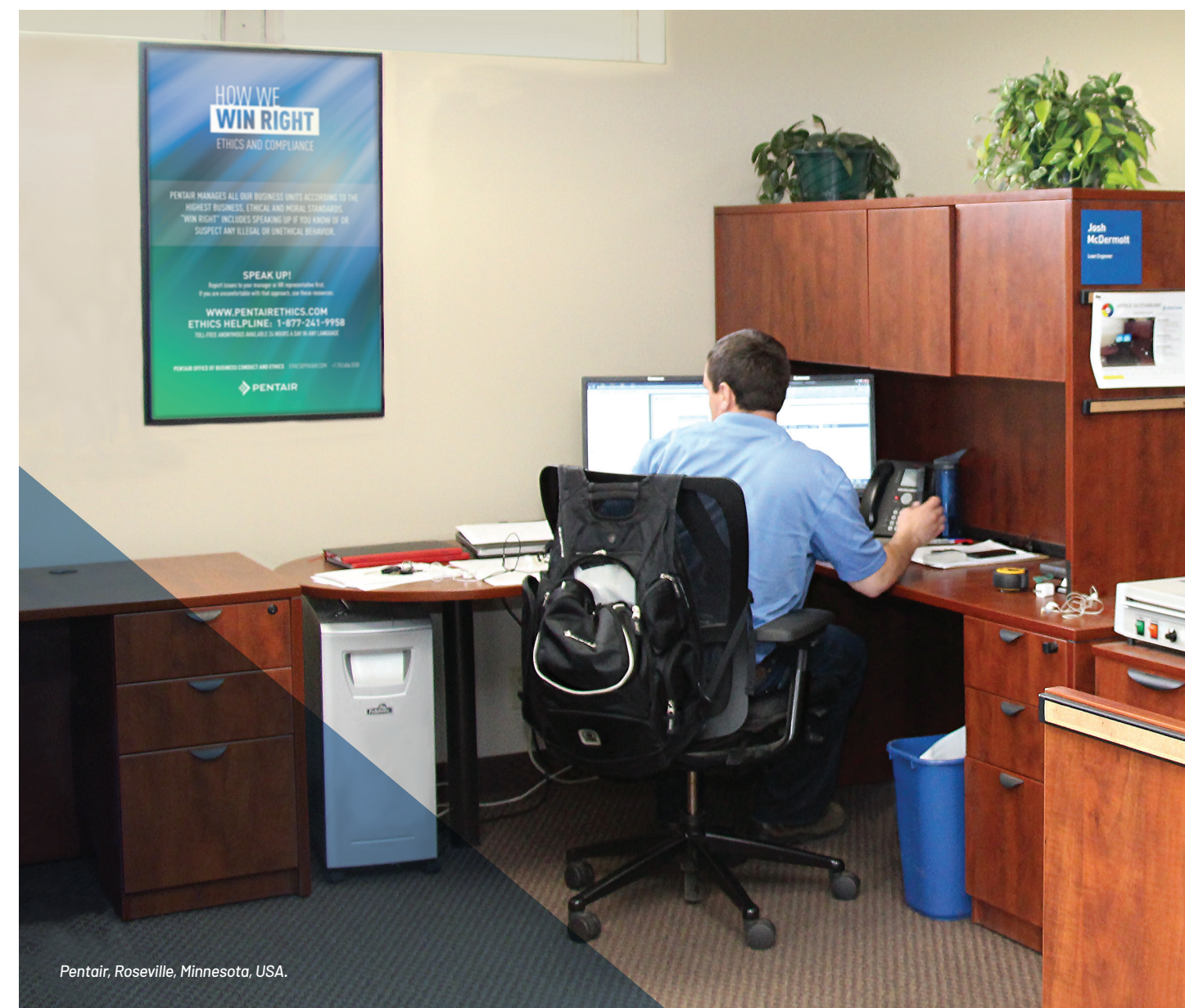
Pentair, Roseville, Minnesota, USA.

R: Pentair prende molto sul serio le accuse di ritorsione. Ciò significa educare dipendenti e dirigenza su come si presentano le ritorsioni e assicurare che ne comprendano le conseguenze. Se viene comprovata un'accusa di ritorsione, l'azienda punirà i soggetti coinvolti fino al licenziamento.