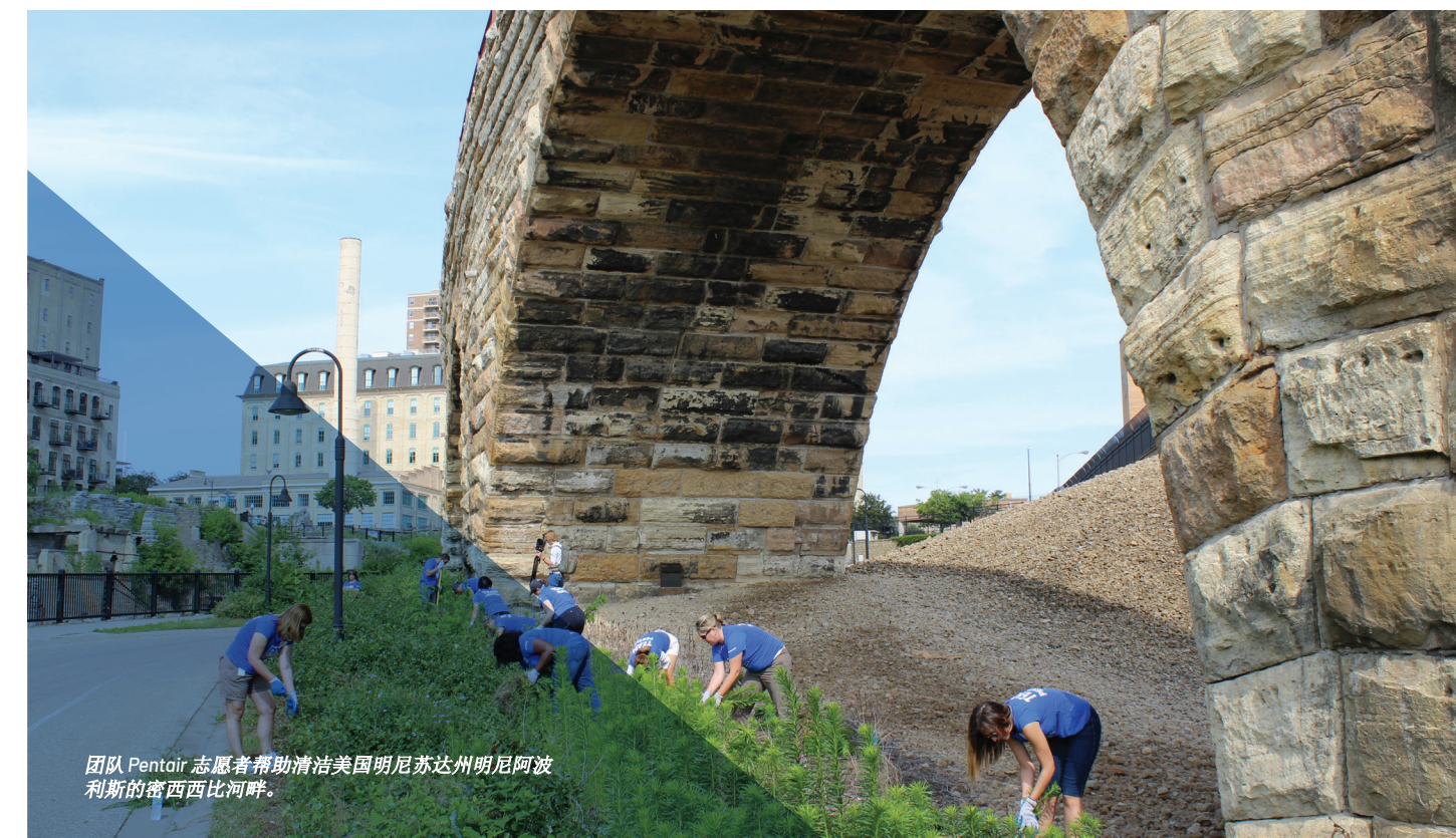
团队 Pentair 志愿者帮助清洁美国明尼苏达州明尼阿波利斯的密西西比河畔。

执行官或董事会成员对本准则免责与否，皆仅能由 Pentair 董事会或董事会管理委员会决定。