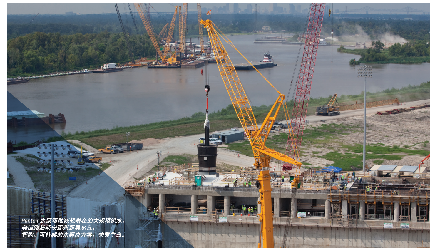
Pentair 水泵帮助减轻潜在的大规模洪水，美国路易斯安那州新奥尔良。智能、可持续的水解决方案。关爱生命。

答： 工厂参观可以接受，但前往迪斯尼乐园是不允许的，这是贿赂的一种形式。在任何情况下，我们都不应该支付客户及其家人前往迪斯尼乐园或其他与 Pentair 业务无关的地方游玩。