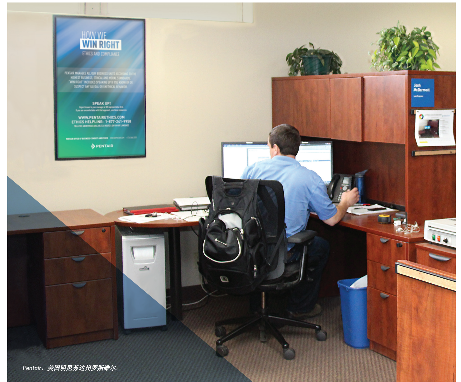
Pentair, 美国明尼苏达州罗斯维尔。

答： Pentair 非常重视对报复的指控。这意味着教育员工和管理层什么样的情况属于报复，确保他们明白后果。如果报复的指控被证实，公司将惩戒所涉及的个人，包括终止聘用。